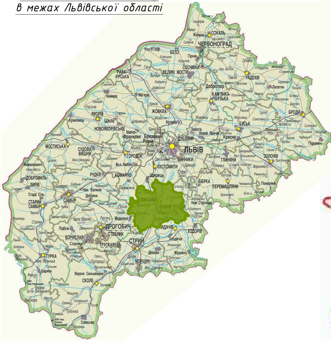
Схема розміщення об'єкту в межах Львівської області